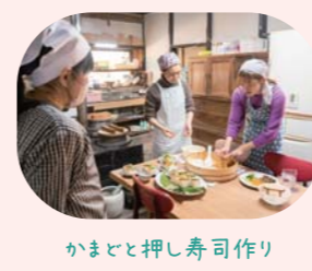
かまどと押し寿司作り