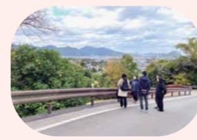
吉田松陰ゆかりの地めぐり