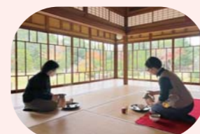
旧家で楽しむ抹茶体験