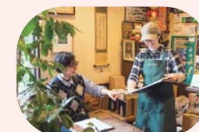
萩のブレンドコーヒー作り

問 萩まちじゅう博覧会 実行委員会事務局 (まちじゅう博物館推進課) TEL 0838-25-3290