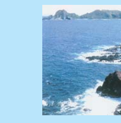
笠山椿群生林 (見頃 2月中旬~3月下旬)