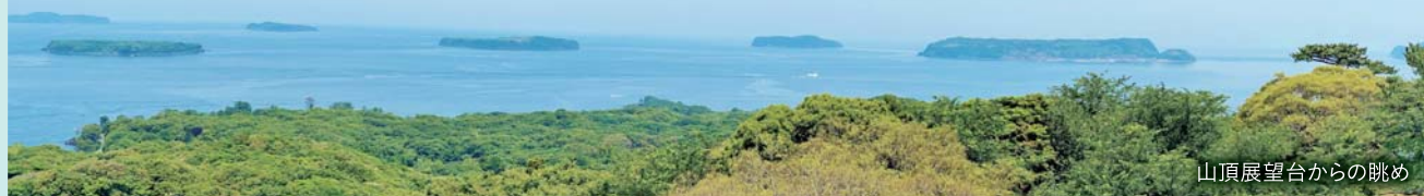
山頂展望台からの眺め

笠山は、北長門海岸国定公園の中心に位置し、山頂に小噴火口を持つ標高112mの小さな火山です。「萩ジオパーク」の見どころの一つである笠山には、自然を体感できるスポットがいっぱい！夏の1日をのんびり過ごしてみませんか？