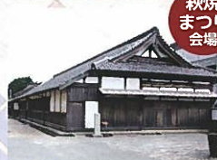
萩・明倫学舎(有備館)

茶の湯に出会うことで日本の「伝統文化」の良さを一盞をもって探求していく集いです。