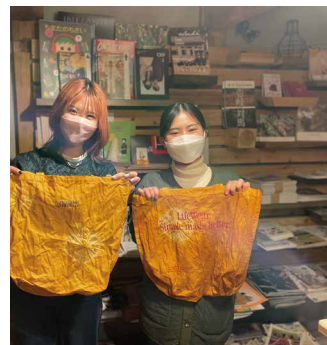
タマネギの皮で古布の草木染め

季節の野菜の収穫や味噌づくり体験など、自然環境に寄り添い暮らすなかで、実践している「手仕事」や「自然農」などを体験プログラムとして商品化し、ナチュラル志向のお客様にお届けしたいと思っています。